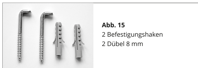
Abb. 15 2 Befestigungshaken 2 Dübel 8 mm